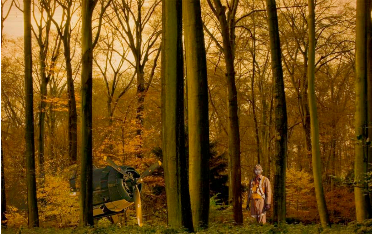
Vuelo 19, Oswald 02, Mitos Colom, 2010