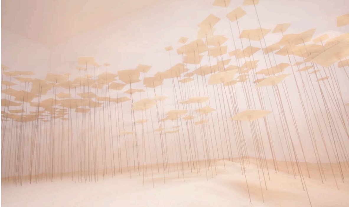
Into the White , Kira Ball, 2009