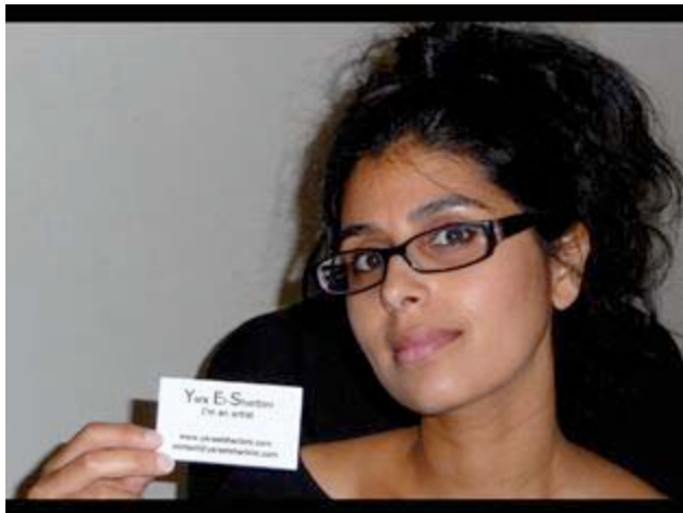
Imagen: Auctions speak Louder than Words , 2008 Video by Yara El-Sherbini

Considerada como una de las principales protagonistas del movimiento Live Art anglosajón, el tono llano y familiar de El-Sherbini desafía las plataformas de expresión tradicionales y elitistas del circuito artístico internacional.