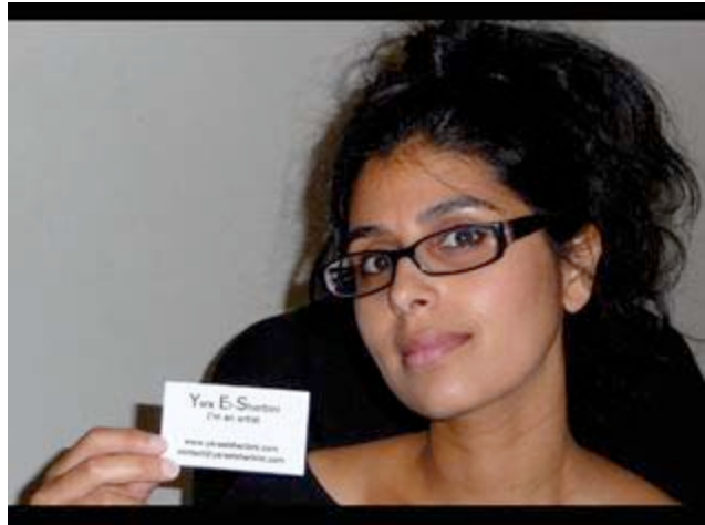
Imagen: Auctions speak Louder than Words , 2008 Video by Yara El-Sherbini

Considerada como una de las principales protagonistas del movimiento Live Art anglosajón, el tono llano y familiar de El-Sherbini desafía las plataformas de expresión tradicionales y elitistas del circuito artístico internacional.