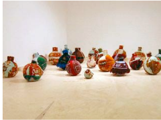
Título: Loaded Objects Año de producción: 2006