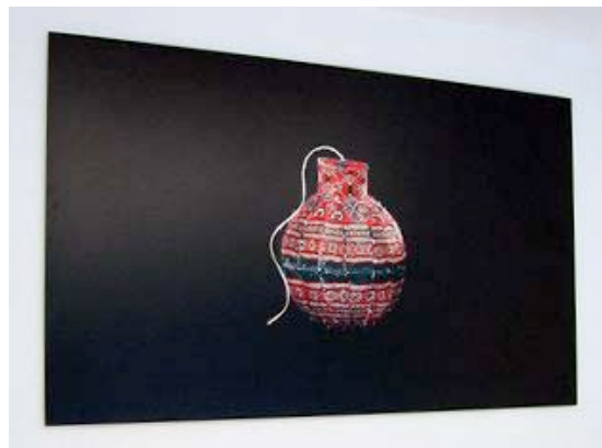
Título: A Carpet Bomb (Persian) Año de producción: 2007