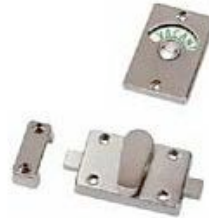
Título: Territorio Libre/Ocupado Año de producción: 2009