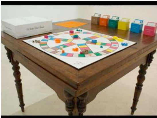
Título: A.R.T. Pursuit Año de producción: 2009 Encargado por The Delfina Foundation