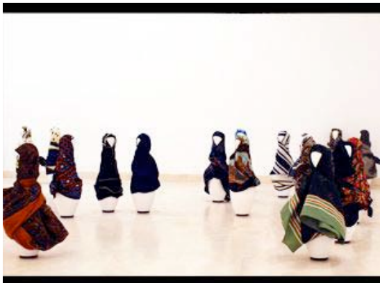
Título: Critical Mass Año de producción: 2008