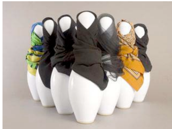
Título: Tipping Point Año de producción: 2008