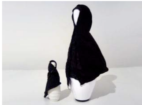
Título: Mother and Child (Skits) Año de producción: 2008

A VEILED WOMAN WAS ARRESTED OF A THREAT TO NATIONAL SECURITY SHE CLAIMED SHE WAS WORSHIPING